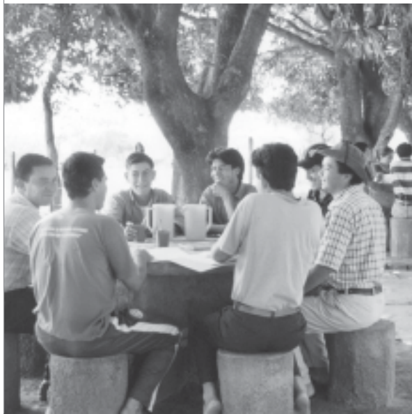
■ TALLER LOCAL - CDE - SECTOR CAMPESINO

desintegrada y fragmentada. Esto último también se ve interrogado por la propia tendencia de muchas experiencias organizativas que reivindican su autonomía y miran con recelo las posibilidades de articulación. En efecto, resulta difícil hallar un sujeto o principio constitutivo central como los que identificaban a la acción colectiva tradicional. Asistimos a una nueva manera de concebir la acción colectiva más próxima a una variedad de formas de lucha y movilizaciones más autónomas, más cortas y coyunturales, menos políticamente orientadas, en las que no se observa una impugnación de las instituciones sino una demanda de vigencia efectiva de las mismas. En consecuencia, la gran tarea del futuro es la reconstrucción de un espacio institucional, donde la política vuelve a tener sentido como articulación entre actores sociales autónomos y fuertes.