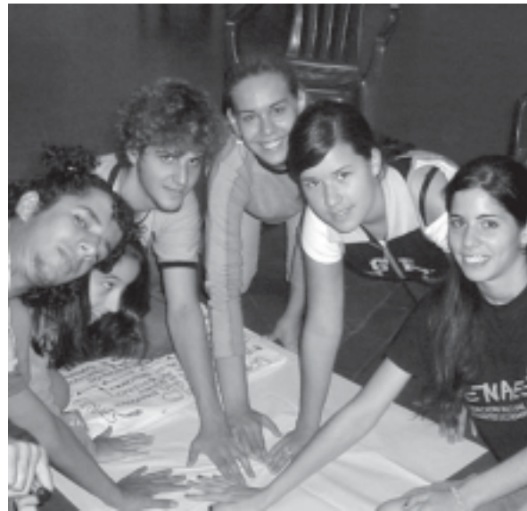
TALLER LOCAL - DECIDAMOS - SECTOR JÓVENES