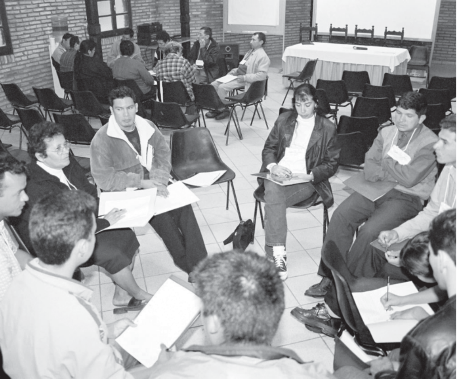
■ ■ ■ TALLER LOCAL - SEPA - INTERSECTORIAL