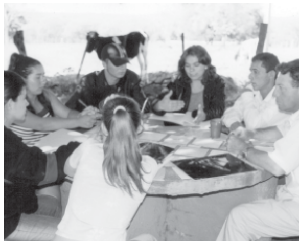
TALLER LOCAL - CDE - SECTOR CAMPESINO

Como ven interesa pensar en la integración como el fortalecimiento de lo local para comprender y avanzar en lo nacional y regional reconociendo la diversidad de los contextos y los tipos de organización apuntando a una política socioeconómica y cultural, en donde las acciones conjuntas ante problemas comunes nos puedan llevar a avanzar en la resolución de nuestra problemática.