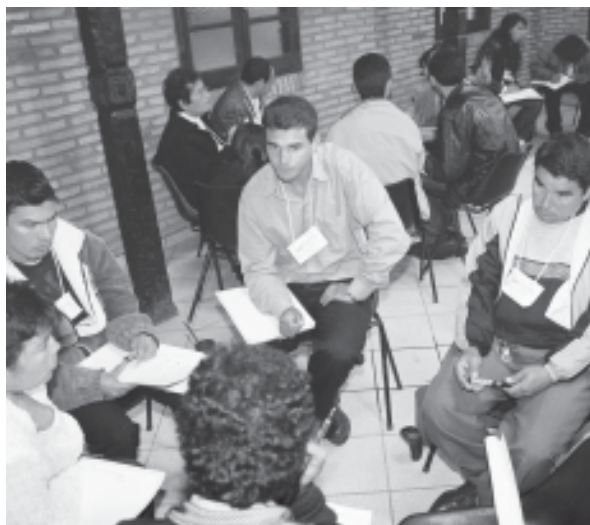
■ TALLER LOCAL - SEPA - INTERSECTORIAL