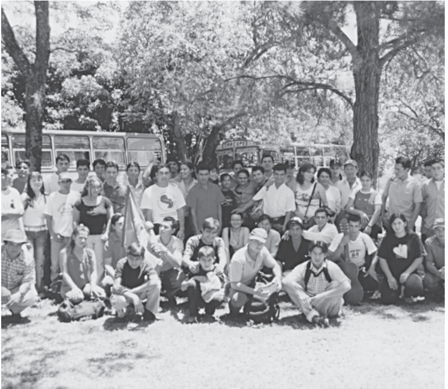
■ ■ ■ TALLER LOCAL - CDE - SECTOR CAMPESINO.