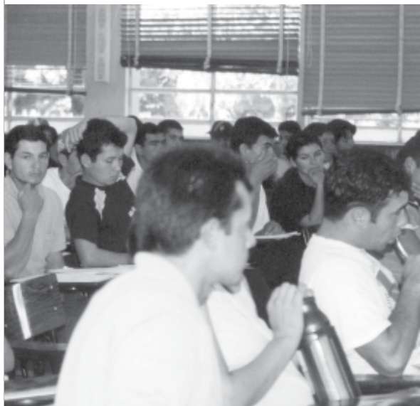
■ TALLER LOCAL - CDE - SECTOR CAMPESINO

Los mecanismos de participación y propuestas tienen ciertas diferencias de acuerdo al sector de donde provengan. En el conjunto de los avances y