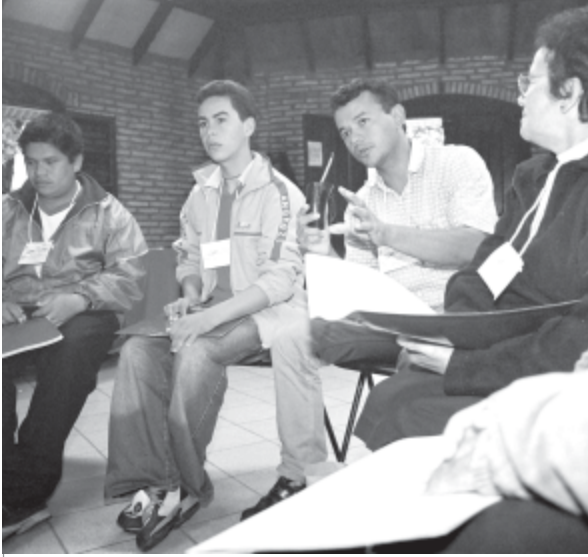
TALLER LOCAL - SEPA - INTERSECTORIAL