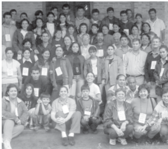
■ TALLER LOCAL - DECIDAMOS -SECTOR POBLADORES

En efecto, el problema de las democracias latinoamericanas no son las elecciones (que, son libres, periódicas y rodeadas de garantías mínimas), sino lo que sucede después de las elecciones. Esto es, cuáles y qué cosas deciden realmente nuestros representantes una vez electos, y cómo rinden cuenta por sus actos de gobierno. Esto tiene directa relación con las reales capacidades de decisión y autonomía que tienen los gobiernos frente a los “poderes fácticos” (militares, grupos económicos, organismos internacionales, etc.) que en algunos