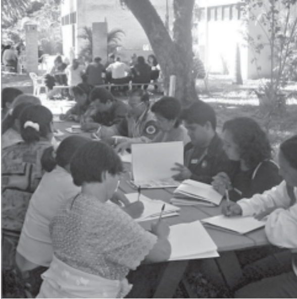
TALLER LOCAL - DECIDAMOS - SECTOR POBLADORES

que perversamente alienta a aceptar su exclusión y fracaso como un fenómeno individual. Dado que reivindica derechos, su interlocutor es primordialmente el estado.