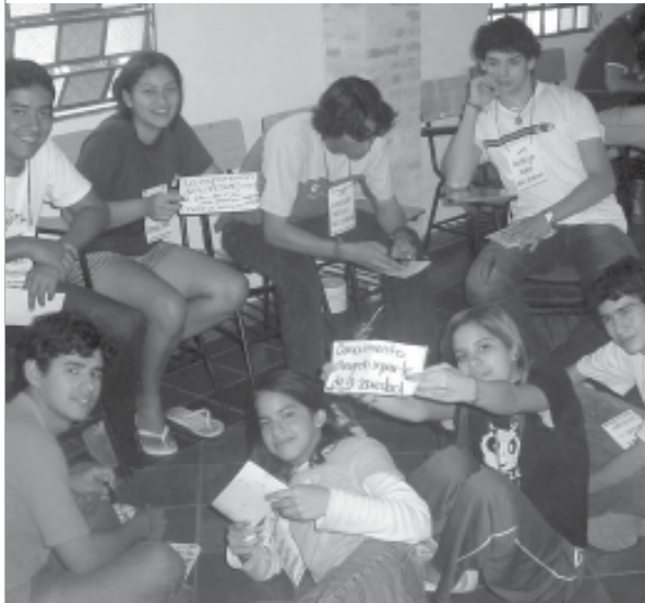
■ TALLER LOCAL - DECIDAMOS - SECTOR JÓVENES

organización para lograr los objetivos propuestos.