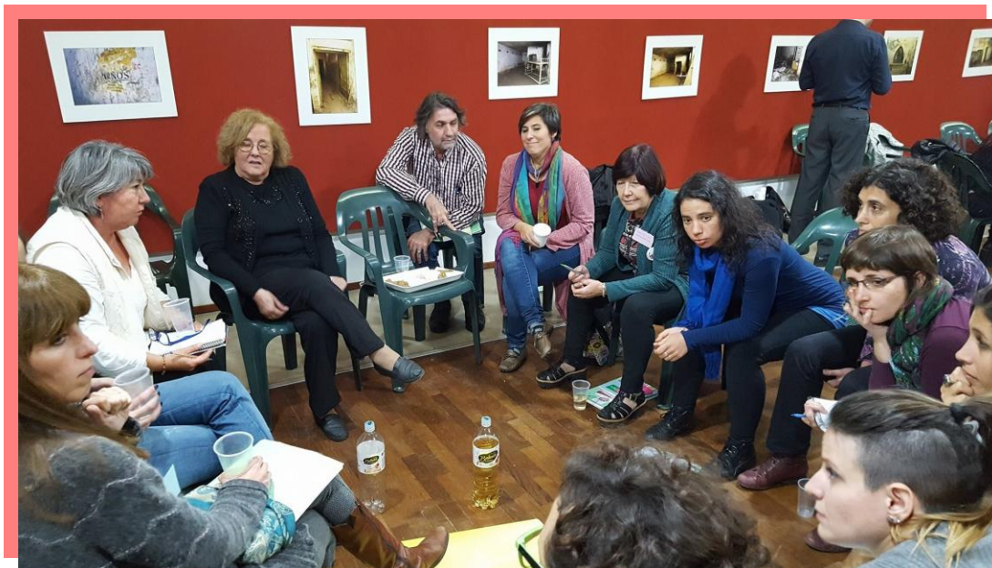
9) Visita al ex Servicio de Informaciones de Rosario, donde funcionó el Centro Clandestino de Detención más grande de la provincia de Santa Fe durante la última dictadura cívico-militar.